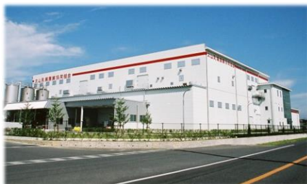
市乳・ヨーグルト新工場