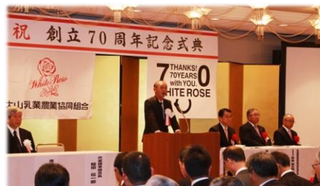
創立70周年記念式典