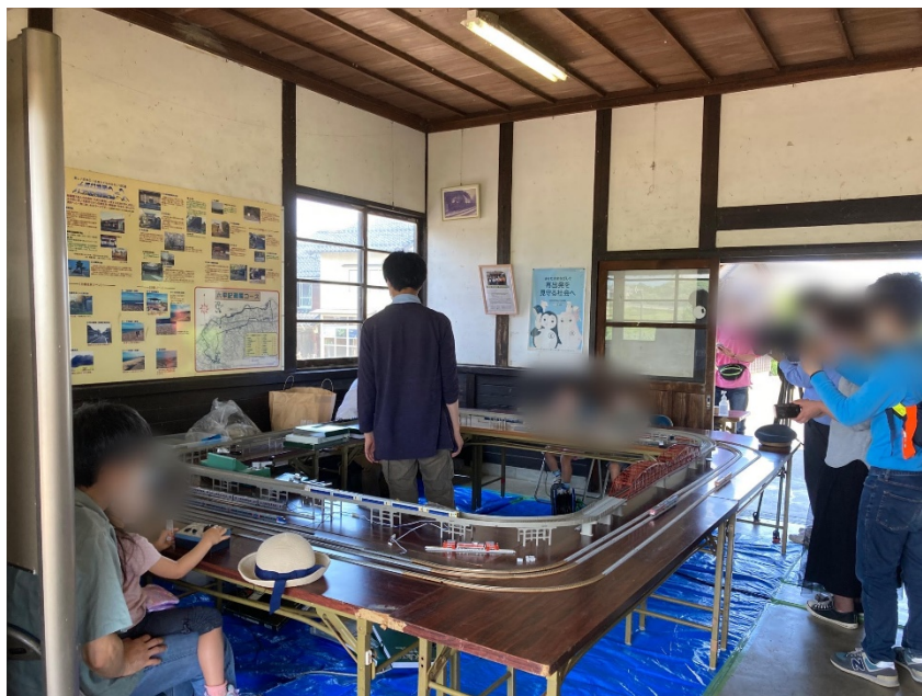
模型運転体験会の様子