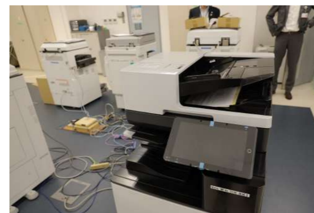
リコーITソリューションズで製作しているコピー機

文系学生も歓迎しています。実際に弊社スタッフの3割位は文系出身です。7割が理系ですが、理系の中でも電気電子やITをやっていない人も多くいます。勿論、これまでやってきた人は使い方などに慣れているので上達が早いのですが、入社後に行う半年の研修の中で仲間同士協力することを呼びかけ、自分が周りに教えてあげるといった認識を持ってもらいます。自分の知識を整理しながら技術を高めることが出来るので教える側、教えられる側の双方にメリットがあります。