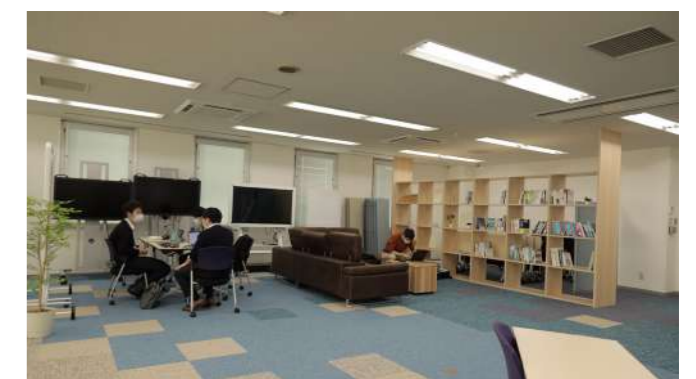
オフィススペース