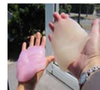
キラキラスライム