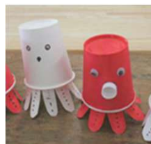
イカさん・タコさん