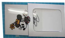
マジックスクリーン